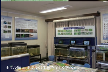
ホテル館。ホテルの生態を楽しく学べる。