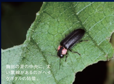
胸部の背の中央に、太い黒線があるのがヘイケホテルの特徴。

の原風景。ポツと灯り、ふわふわと淡い光跡を描いて飛ぶ姿は、息をとめて見入ってしまうほど幻想的です。ただし、月明かりの日は出ない、恋人探しは夜19時半ごろから20時過ぎぐらい、などホテルにはホテルの都合があります。どんな出会いになるのかはホテル次第です。それも含めて日本の夏的情趣を味わっていただけたら嬉しいですね」