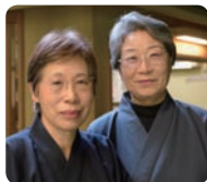
左:抹茶を点ててくれるスタッフの方。「ハイキングを兼ねて、ぜひ鎌倉にお越しください」。

と表情が変化する様は幽玄で、いつまで眺めていても飽きることはありません。そして竹林の最も奥には「休耕庵」と名つけられたお茶席があり、竹林を眺めながら抹茶と干菓子