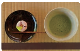
上右:浄妙寺本堂。1188(文治4)年に足利義兼によって真言宗の「極楽寺」として創建され、後に禅宗の臨済宗の寺院となって「浄妙寺」と改称した。上左:「喜泉庵」。左:鎌倉の和菓子の名店「美鈴」の上生菓子と抹茶のセット(1,000円)。干菓子とのセットもある。