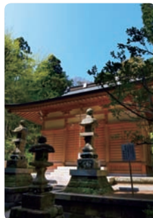
左右:切通から少し道を逸れて山道を登ると、この辺りの鎮守である熊野神社がある。左左:熊野神社との分岐を示す道しるべ。