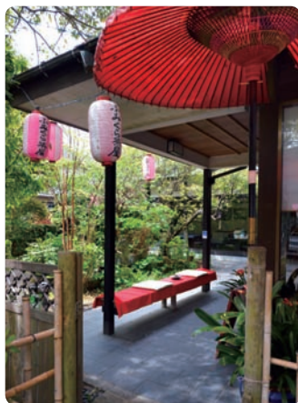
縁台に座り、庭を眺めながら休むこともできる。