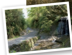
上:十二所神社バス停から川に沿って歩くと三郎の滝にたどり着く。ここから先が切通。