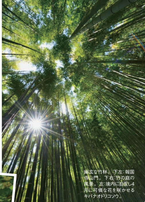
幽玄な竹林。下左:報国寺山門。下右:竹の庭の風景。左:境内に自生し4月に可憐な花を咲かせるキバナオドリコソウ。