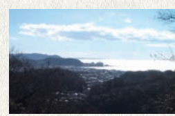
大仏ハイキングコースから鎌倉の海を望む。