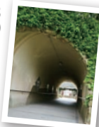
右:神奈川県立金沢文庫。展示室では北条氏の歴史をたどることができる。上:称名寺と県立金沢文庫をつなぐトンネル。隣には、中世に使われていた隠道がある。

また、同館が建つ地は元の金沢文庫跡と推定されており、文化財を、文化財が形成された環境の中で味わえるという、貴重な歴史博物館でもあります。