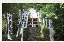
金沢街道沿いにある、鎌倉最古の寺院、杉本寺の苔の階段。

杉本寺や浄妙寺(P6)、報国寺(P7)など、金沢街道沿いの寺院を巡りながら歩くコース。朝夷奈切通(P5)に続く。(※帰りはバス停「朝比奈」から鎌倉駅行き、または金沢八景駅行きバスで)