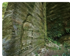
上:頂上から少し朝夷奈方面へ下った辺りの、最も切通らしい風景。中左:途中にある岩に彫られた仏様。右:路傍の石仏。江戸時代のもの。

になっています。途中、切通の壁面に彫られた仏像や鎌倉時代頃の墓群であつたやぐらの跡などが残っています。両側の崖によって切り取られた高い空を眺め木々を渡る風の中に身を置くと、中世の時代を感じる事ができます。