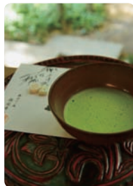
上左:休耕庵。上右:鎌倉彫のお盆に載せて供される抹茶と干菓子(500円)。竹の庭の入口であらかじめ料金を支払う。