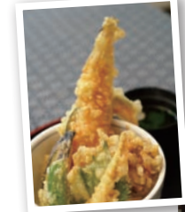
右:母屋は江戸時代に建てられたもの。上:「穴子天井」(1,300円)。小鉢と漬け物、吸い物、小さなフルーツがつく。