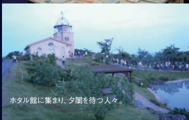
ホテル館に集まり、夕闇を待つ人々。