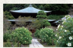
天園ハイキングコースで立ち寄りた瑞泉寺。花の寺として有名。